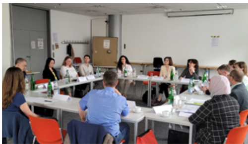
Austauschtreffen in Mannheim

Am 22. Mai 2023 trafen sich die Beratungszentren und Beratungsprojekte zur Anerkennung ausländischer Berufsqualifikationen mit Frau Dr. Leidig, MdL, Staatssekretärin im Ministerium für Soziales, Gesundheit und Integration Baden-Württemberg, in Mannheim.